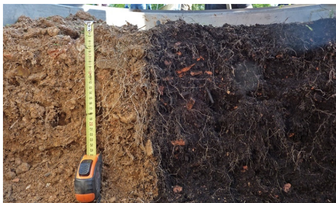
Siterre-Un programme qui a permis de Construire des sol fertiles à partir de déchets urbains

Contact presse : Ludovic Provost, chargé de communication Plante & Cité ludovic.provost@plante-et-cite.fr / 02.41.72.17.37