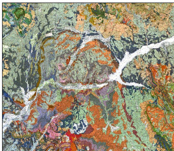
Exemple : Région de Gap (Hautes-Alpes)

Web : http://www.brgm.fr/content/cartes-geologiques-numeriques