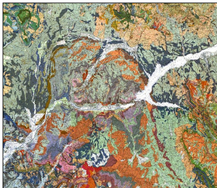
Exemple : Région de Gap (Hautes-Alpes)

Service Géologie Centre National de Consultation de Paris Tél. : 01 47 07 91 96 Fax : 01 43 36 76 55 / 02 38 64 34 02 Mèl : km.nay@brgm.fr Web : www.brgm.fr/brgm/GEO/prod_num.htm