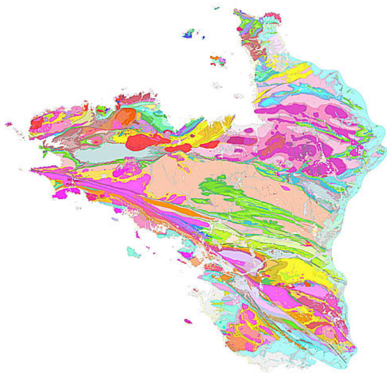
Carte géologique à 1/250 000 du Massif armoricain