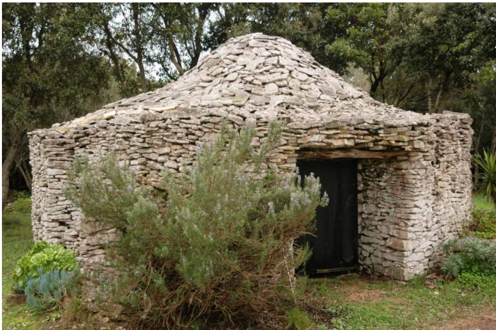
Baracun (borie) du Causse de Bonifacio