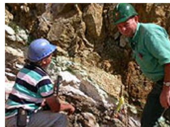
En discussion sur une mine avec les professionnels