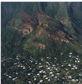
La zone des glissements du Mont-Dore